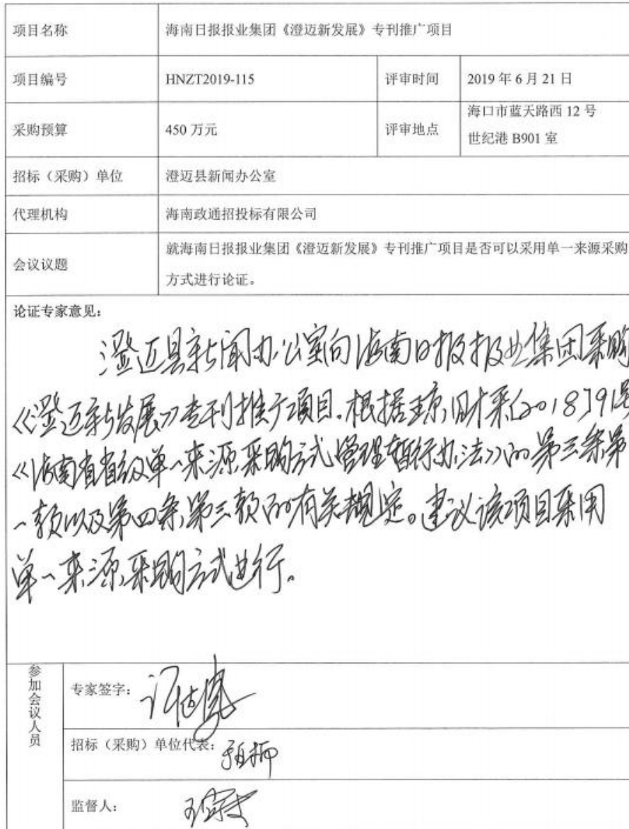
采购方式论证结果记录表 3-3