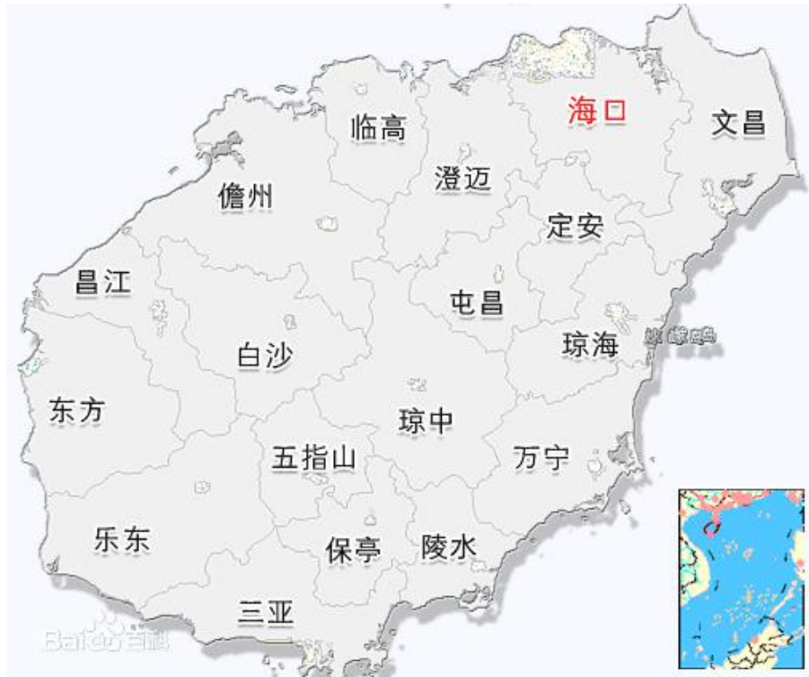
图 2-2 海口市区位示意图