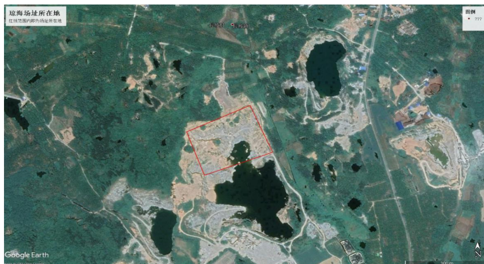
图 1-1 项目所在地示意图

项目建设地点位于琼海市长坡村南侧 370m 处金泰石场内,现场为花岗岩采石场,场址内最低标高为-7m,最高标高为 51m,场址东南角有一条土路延伸至场址东侧,项目所在地示意图如图 1-1 所示;场地地势起伏较大,东面、西面、北面地势较高,南面地势较低,形成开口向南的边坡;勘察时所测孔口地面标高为 1.89-52.33m,最大高差为 50.44m;项目占地面积 4.89 万平方米。