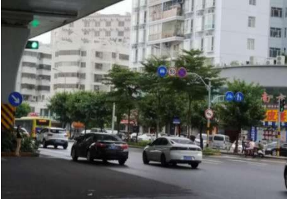
现状出口处的 Y 型杆件

现状部分路口在出口处已经设置有 Y 型杆件，主要用于设置相关小型交通标志，主要安装的小型标志包括：禁停、禁鸣、限速。其他相关标志如机动车道、非机动车道、步行等。