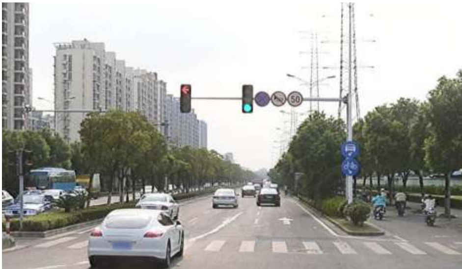
利用信号灯杆设置小型标志

对于没有 Y 型杆件的路口，可利用信号灯杆件设置相关小型标志，信号灯杆件上的小型标志主要有三种：限速、禁停、禁鸣、机动车道和非机动车标志。其他小型标志原则上不再设置，如有需设置的相关标志，除有特别要求外，不设置在信号灯杆上。