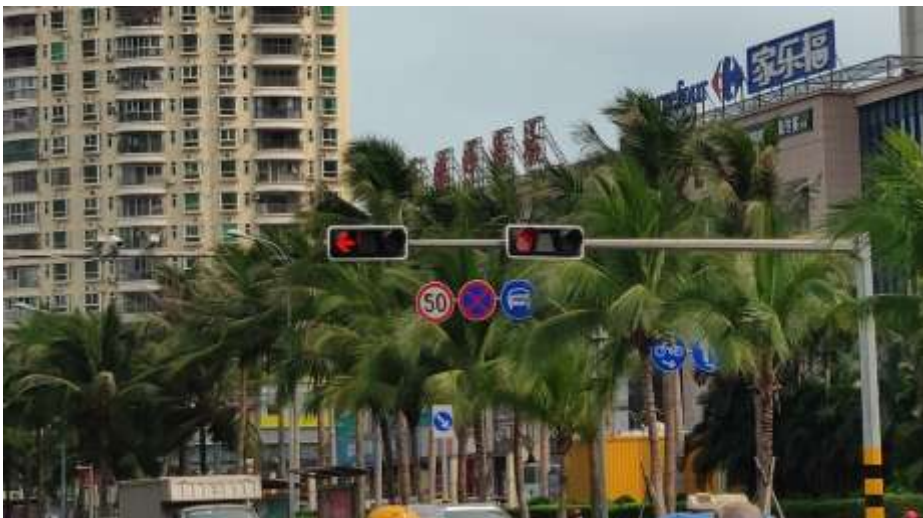
Y 杆与信号灯杆距离近（拆 Y 杆）

对于设置有 Y 型杆件进口道，若 Y 型杆与信号灯杆距离较远，没有相互遮挡的情况时，保留 Y 型杆，相关小型标志，统一设置在 Y 型杆件上；对于 Y 型杆与信号灯距离较近，或有相互遮挡时，拆除 Y 型杆，统一将“限速、禁停、禁鸣”等标志设置在信号灯杆上。