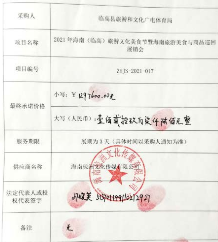
竞争性磋商（最终报价）表